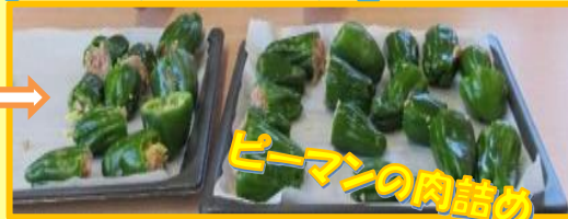
ピーマンの肉詰め