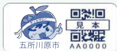
▲おでかけ見守りシール

1人暮らしの方や、ご家族が遠方にいらっしゃる方等、日々の生活で外出等に心配のある方はお気軽にご活用ください。