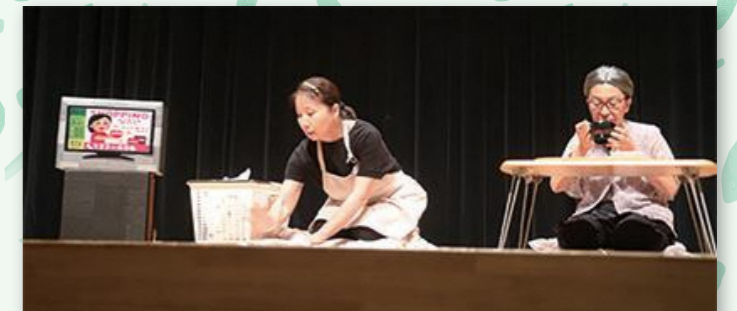
▲寸劇で学ぶ認知症