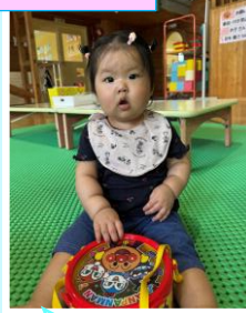
太鼓がお気に入り！