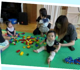
みんなでなかよくあそんだよ♡