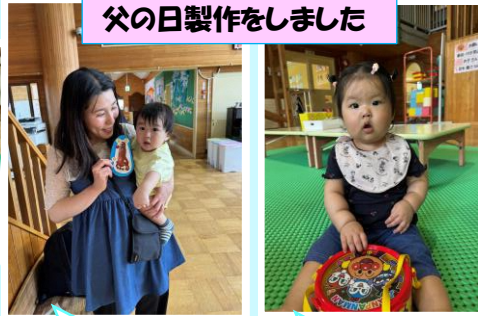
父の日製作をしました