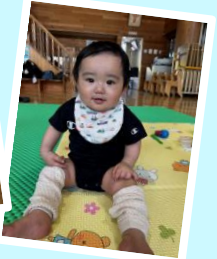
にこにこげんきいっぱい！