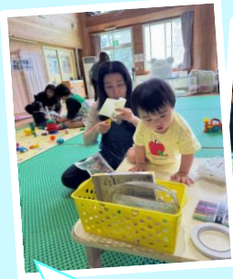
パパにフレゼント♡

園の給食を体験できます(先着10名・予約制・毎月第2金曜日) ※1食200円 ※離乳食、アレルギー対応あり