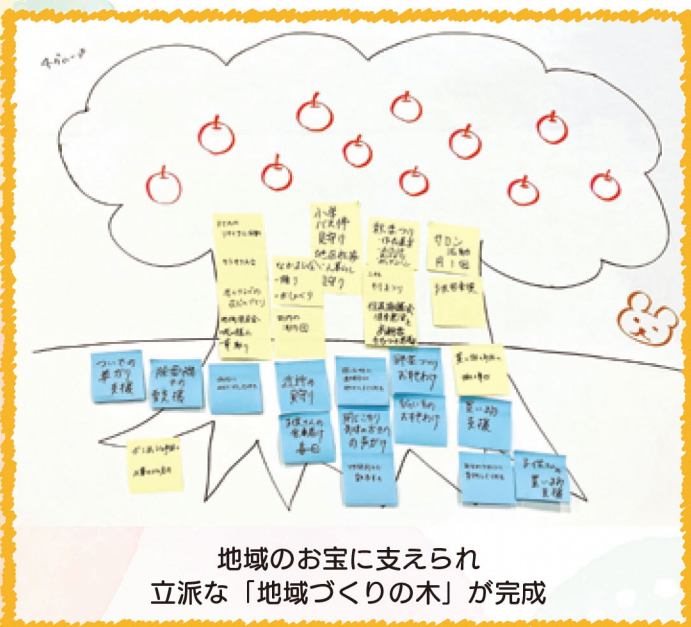
地域のお宝に支えられ 立派な「地域づくりの木」が完成