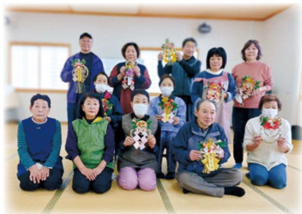
最後には皆さんで記念撮影