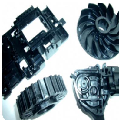
各種プラスチック成型品(左)

工場には様々な工作機械を揃えていますが、人間の力が必要不可欠です。ぜひ我が社のような製造業に興味を持ってみてください。