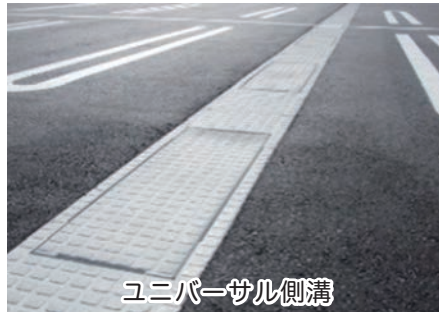
ユニバーサル側溝