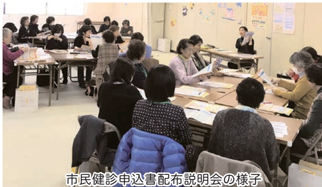
市民健診申込書配布説明会の様子

今後も、健康づくりや子育て等で気がかりなことがありましたら、地域の保健協力員に、お気軽に声をかけください。