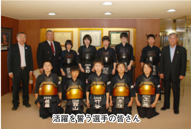
活躍を誓う選手の皆さん

6月13日、全国道場少年剣道大会に出場する五所川原剣道協会の選手の皆さんが市長を訪問しました。