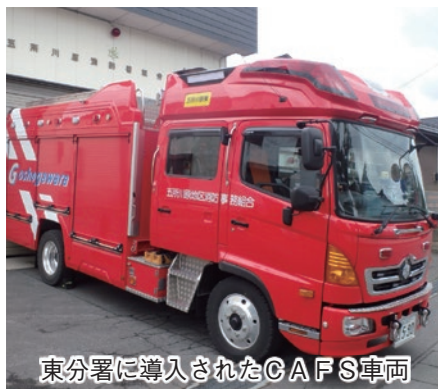
東分署に導入されたCAFS車両

CAFS (Compressed Air Foam System) とは水を泡に置き換えることで、水分の気化熱を有効に利用して冷却するシステムです。CAFS放水をした付近は大変滑りやすく危険なため、消防隊の活動中は火災現場に近づかないようご協力をお願いします(火災現場付近にお住まいの皆さんに説明書を配布しますので、そちらもご覧ください)。