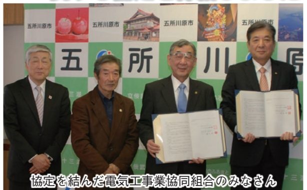
協定を結んだ電気工事業協同組合のみなさん

本協定は、市内で災害が発生した際に、指定避難所等の避難施設や防災の拠点となる施設において通電が不能となった場合の施設の電気設備等の復旧に関して、五所川原地区電気工事業協同組合と市が相互に協力し、迅速かつ的確に応急復旧活動を遂行するために必要な事項を定めたものです。