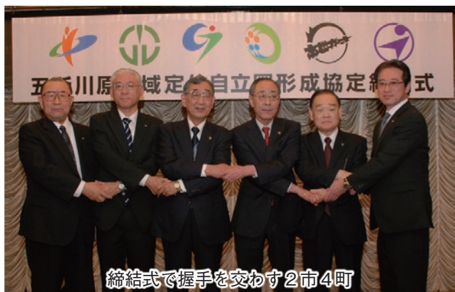
締結式で握手を交わす2市4町

昨年8月に定住自立圏形成に向けた協議をスタートさせ、12月には本市議会で中心市宣言を行い、各市町議会における協定書の議決を経て、本年3月30日にホテルサンルート五所川原にて締結式を開催しました。