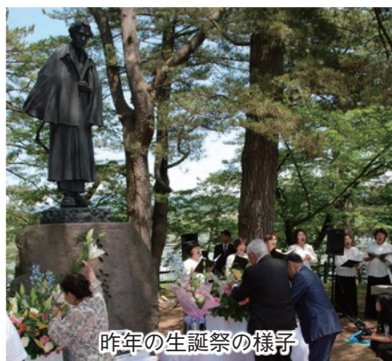
昨年の生誕祭の様子

* 昼食会参加ご希望の方は、6月8日(水)までに電話にて申込み下さい（当日の申込みは、受付しませんのでご了承ください）。