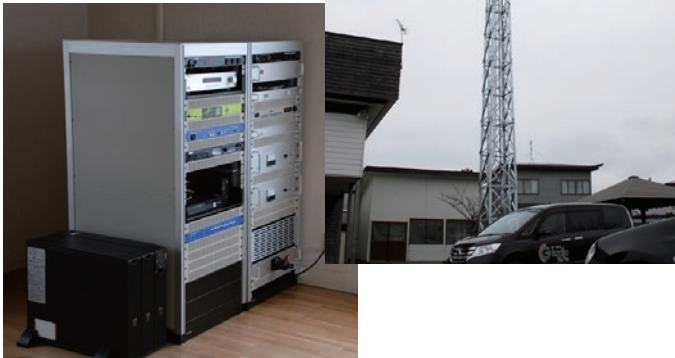
金木地域・市浦地域に中継局を整備しました

今後も、様々な情報伝達手段で、市民と行政との情報共有および災害に強い安全・安心なまちづくりに取り組んでいきます。