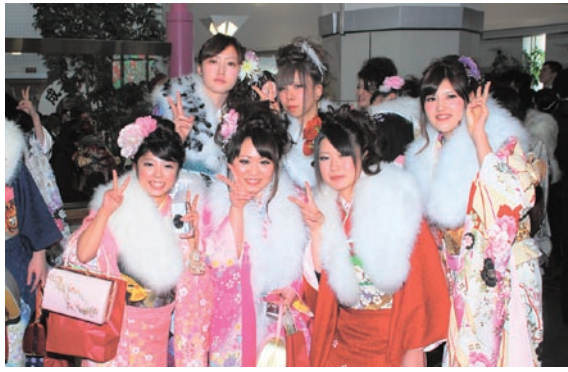
平成25年 成人式の様子