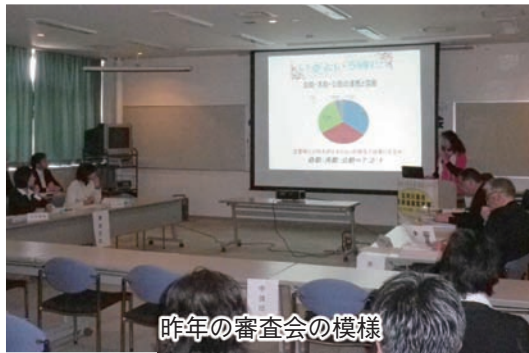
昨年の審査会の模様