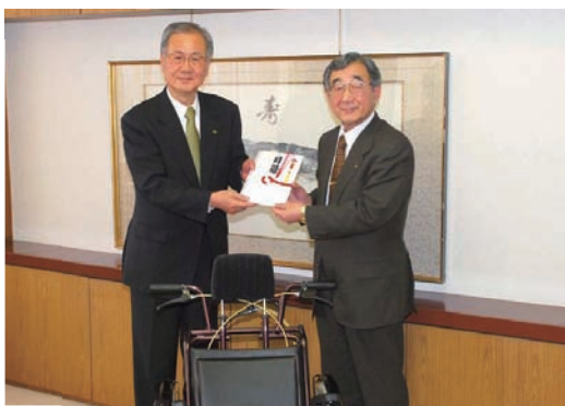
車いすを寄贈する青森県遊技業協同組合・林支部長(左)