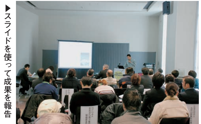
▶スライドを使って成果を報告