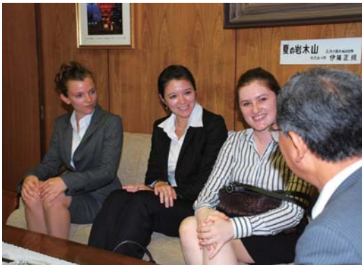
▲(左から)アドリさん、ケリーさん、テイラさん「日本語もまだ話せませんが、津軽弁も覚えたい」と意気込みを語りました。