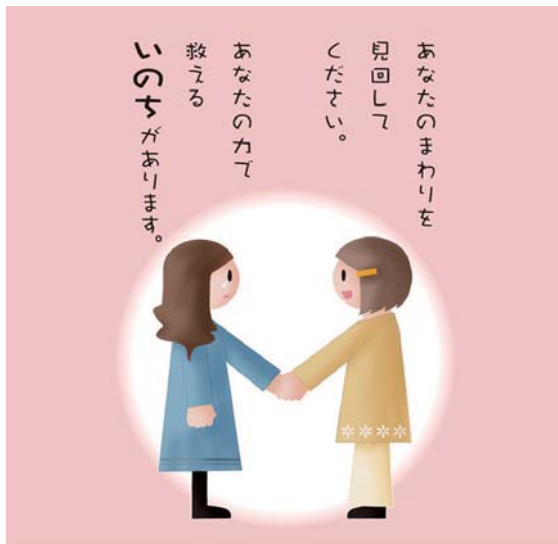
自殺予防週間広報ポスターより

この週間にあわせ、自殺予防について皆さんも考えてみませんか。あなたの方で救えるいのちがあります。