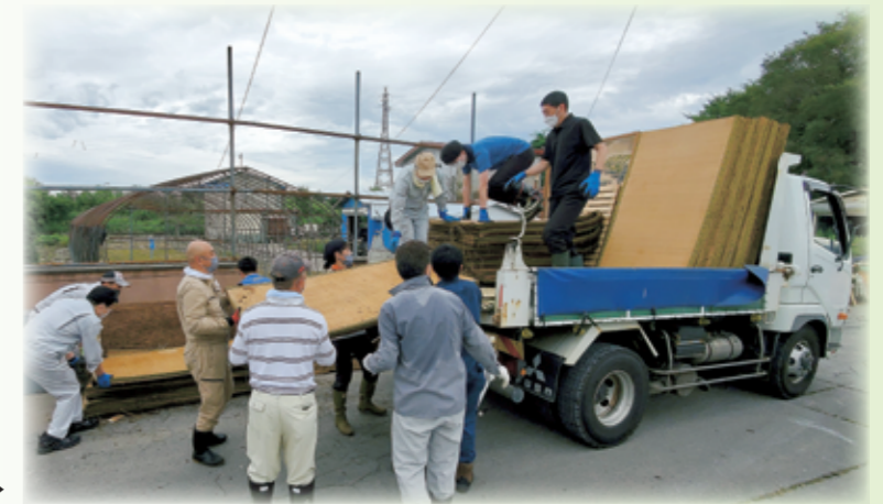
災害ボランティアの様子▶