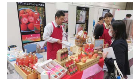
「新商品発表会」の様子