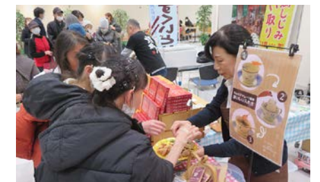
「五所川原市ふるさと新商品フェア」の様子