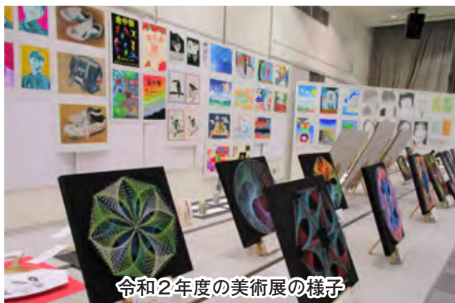
令和2年度の美術展の様子

児童生徒の美術作品を広く市民の方に鑑賞していただき、図工教育・美術教育の充実と向上を図るため、第18回市内小・中学校美術展を開催します。