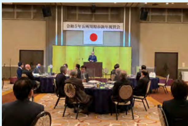
『令和5年五所川原市新年祝賀会』の様子

「交流人口」や「関係人口」を増やすことも重要ですが、真に地域社会が元気になるために、市民が元気であることが前提となることから、地域でさまざまな活動を行う「活動人口」を増やしたいと考えています。ここに住む人たちが生き生きと活動し、横のつながりを深め、目的を共有して何かに取り組むことが重要であり、その成功例が、前回のコラムでも申し上げましたが、大盛況であった昨年9月の「キッズフェスタ2022 in 五所川原」、そして、10月の「ホコ天マルシェごしょがわら」であり、各民間団体の連携とマンパワーが大きな成果を生み出しました。こうした取り組みを足掛かりに、民間が主役となって地域を元気づける取り組みをより一層活発化させ、子どもから高齢者まで多くの市民が活躍する「活動人口」を増やし、地域全体の活力を底上げして、持続可能な「五所川原版市民協働社会」を構築していきたいと思っています。