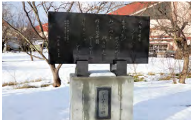
移設されたシーハイルの碑