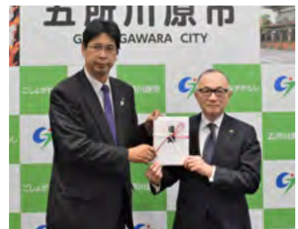
目録を手渡した今会長(左)