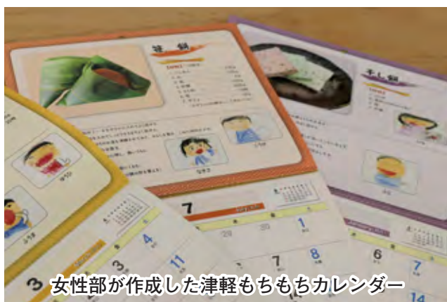
女性部が作成した津軽もちもちカレンダー