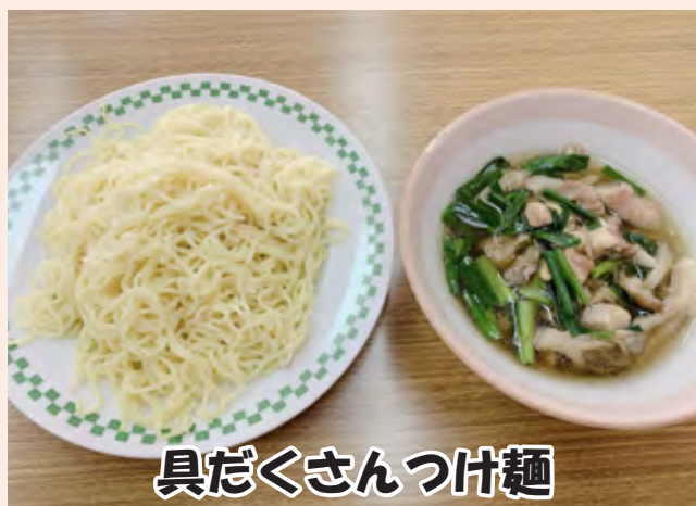
具だくさんつけ麺