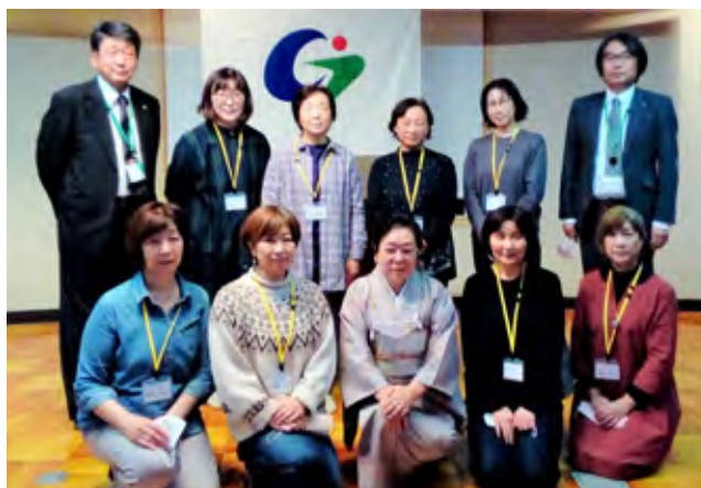
新たに加わった食生活改善推進員の皆さん