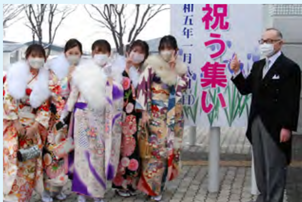
『令和5年五所川原市はたちを祝う集い』の様子

馬肉の生産量は熊本県が有名ですが、青森県も全国で上位に位置しており、その中でも「金木の馬肉」の食味は、本場の熊本県や福島県等と比べても引けを取らないと思っています。五所川原市のふるさと納税の返礼品の中でも、米やりんご以外では「十三湖産のしじみ」に次いで高い人気を誇る品となっています。今や金木にとって「ソウルフード」となった「馬肉」をはじめ、金木のグルメを存分に満喫できる、子どもから大人まで楽しめる盛りだくさんの内容となっていますので、ぜひ足を運んでいただければと思います（3ページ、26ページ掲載）。