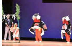
立佞武多囃子と踊り