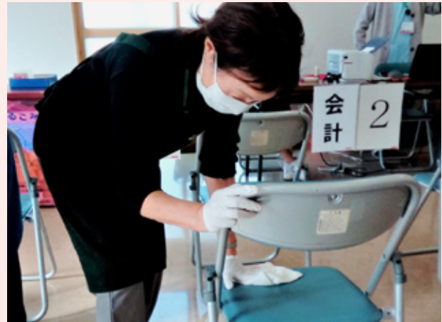
市民健診会場のいすを消毒する様子