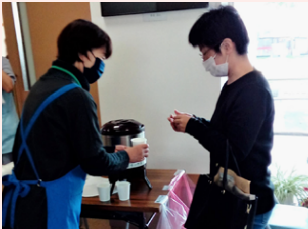
胃のバリウム検査終了者に水を提供する様子