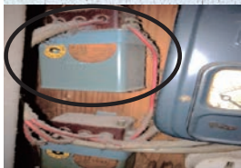
低圧進相コンデンサー の設置例

PCB廃棄物は、右表の処分期限までに処分することが義務付けられています。今一度、PCBが使用された