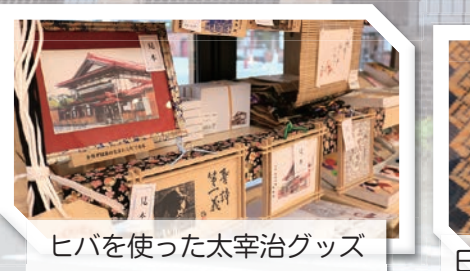
ヒバを使った太宰治グッズ