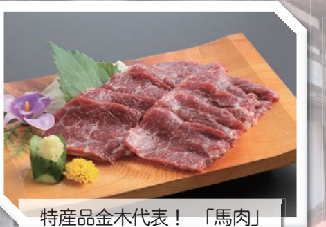
特産品金木代表！「馬肉」