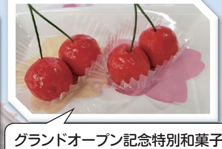
グランドオープン記念特別和菓子 プレゼント！(先着200組様)