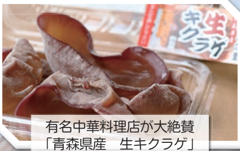
有名中華料理店が大絶賛 「青森県産 生クラゲ」