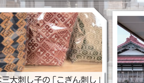
日本三大刺し子の「こぎん刺し」