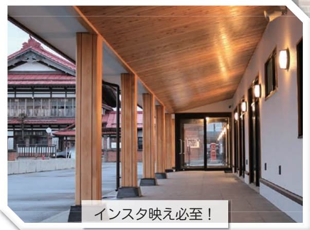
インスタ映え必至！