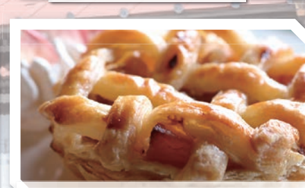
1日5個限定「駅舎アップルパイ」