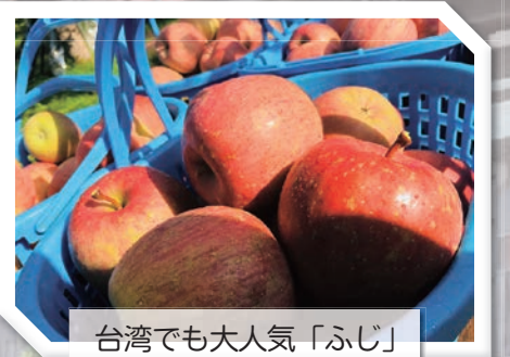
台湾でも大人気「ふじ」