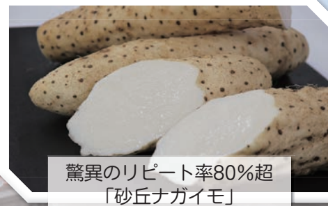
驚異のリピート率80%超 「砂丘ナガイモ」