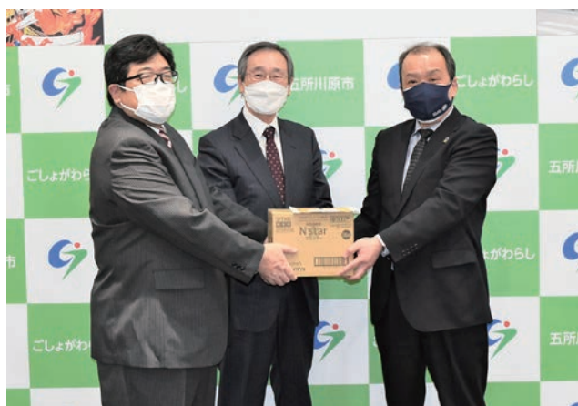
消毒液を手渡した岡田代表取締役(右)