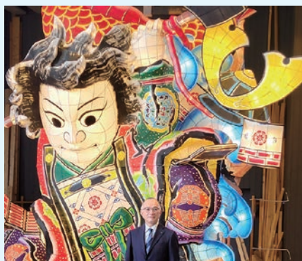
新作立佞武多「金太郎」完成披露立ち合い

当施設は、「株式会社かなぎ振興舎」が管理運営を担いますが、「産直メロス」の可能性を大きく花開かせるためには、地域の皆さんが主役となって、ここにしかない魅力を地域の皆さんで作り上げていただくことが重要です。行政といたしましても、五所川原市の新たな「顔」として成長するよう全力でバックアップしていきたいと考えていますので、市民の皆さんにも応援していただきますようお願いいたします。