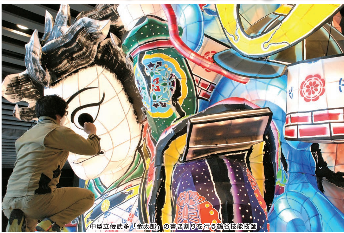
中型立佞武多「金太郎」の書き割りを行う鶴谷技能技師

中型立佞武多「金太郎」の面に墨を入れる「書き割り」が3月29日、立佞武多の館で行われました。