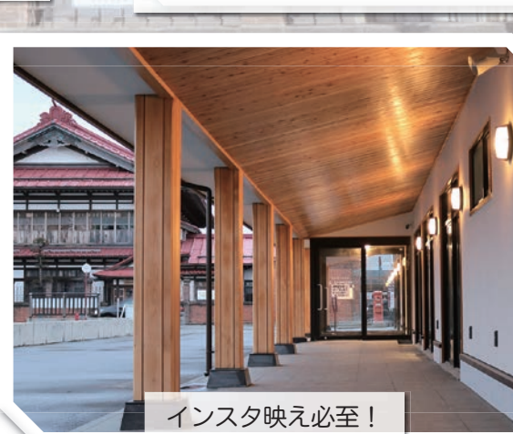
インスタ映え必至！