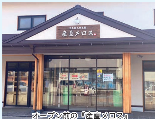
オープン前の『産直メロス』