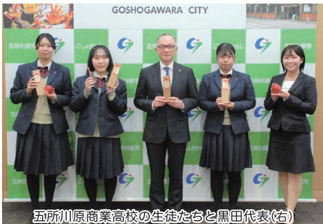
五所川原商業高校の生徒たちと黒田代表(右)