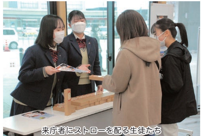
来庁者にストローを配る生徒たち