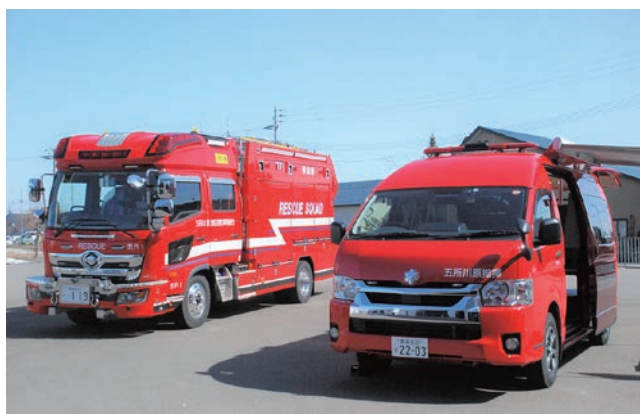
配備された救助工作車(左)と指揮車(右)