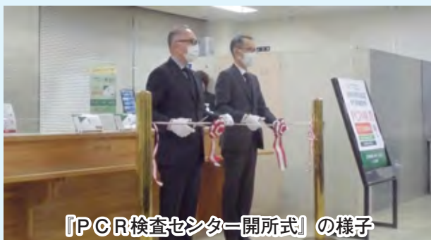
『PCR検査センター開所式』の様子

このほど国の政策の一つとして、マイナンバーカードの新規取得等にマイナポイントが付与されるなど、取得促進に向けた取り組みが進められています。市では、仕事や家事、育児などで平日に窓口にお越しいただくことが困難な方が平日以外でもマイナンバーカードの受け取りができるよう、2月第2、第4の土曜日と日曜日に市役所本庁舎の窓口開庁を行います。また、スマートフォンの扱いに不慣れな方や顔写真の用意ができない方のため、申請手続きのサポートをしています。ご利用には事前予約が必要ですので、市民課または各総合支所までお問い合わせいただくようお願いします（ 今月号8ページ掲載 ）。