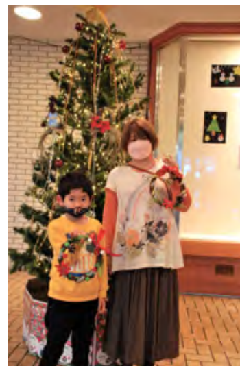
手作りのリースを持って記念写真を撮る親子

夕方には、参加者のカウントダウンを合図にイチョウの木などに飾られたイルミネーションが点灯しました。