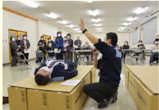
防災管理課職員が救急蘇生の方法を説明