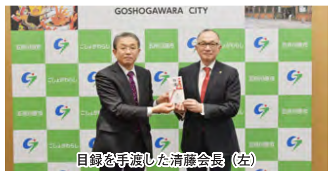
目録を手渡しした清藤会長(左)