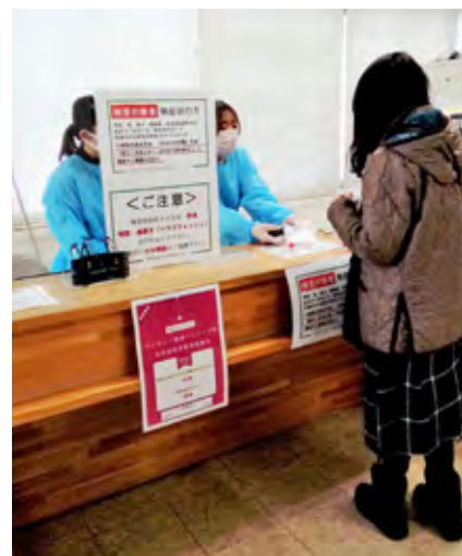
PCR検査センターの受付