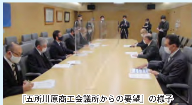
『五所川原商工会議所からの要望』の様子