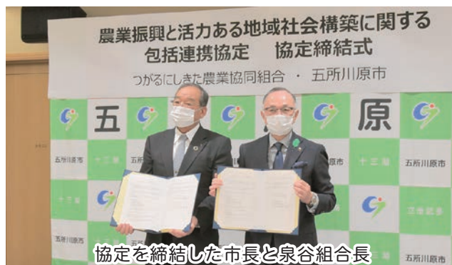
協定を締結した市長と泉谷組合長