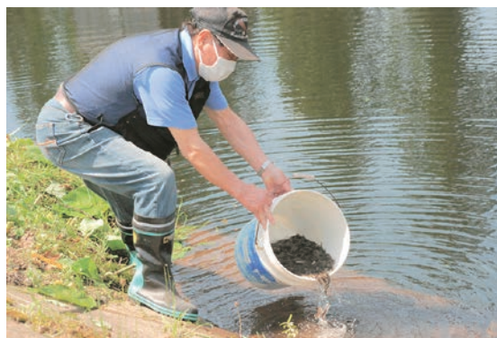
イワナの稚魚を放流する関係者