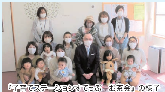
「子育てステーションすてっぷ お茶会」の様子