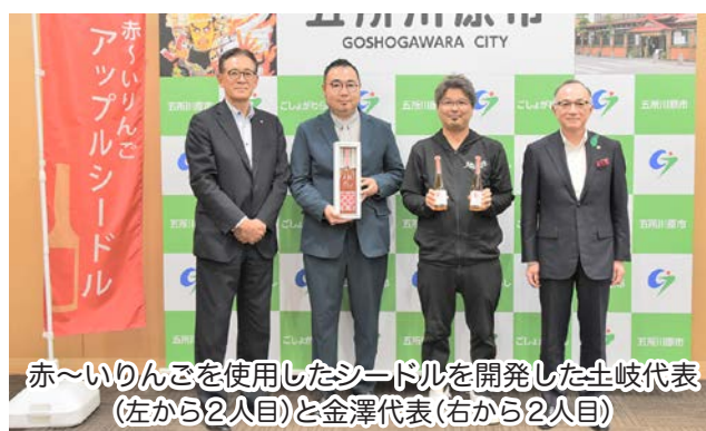
赤〜いりんごを使用したシードルを開発した土岐代表(左から2人目)と金澤代表(右から2人目)

また、金澤代表は「赤〜いりんごの商品開発を行ってきましたが、シードルの開発は初の試みでした。飲み口はドライのため、どんな料理にも合うと思います」と商品の出来栄えについて話しました。