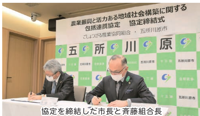
協定を締結した市長と斉藤組合長