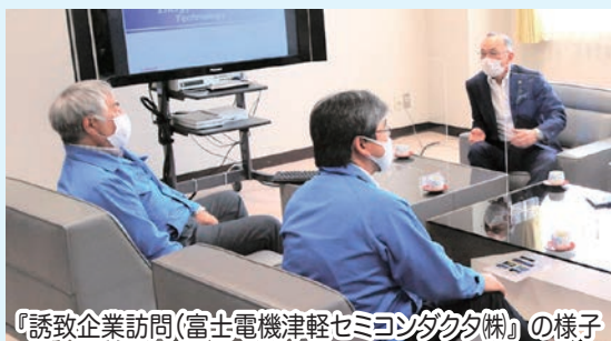
「誘致企業訪問(富士電機津軽セミコンダクタ株)」の様子

今後は、こうした市の特産品を活用し、民間事業者の皆さんの知恵とノウハウを活かしながら、当市ならではの魅力ある商品や特産品の開発に、官民一体となって取り組んでいければと考えています。