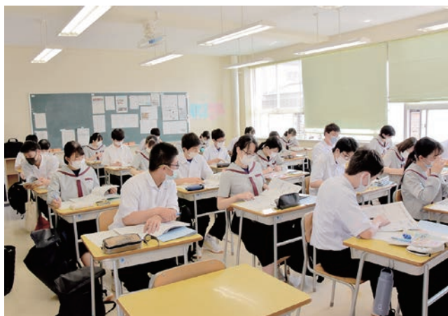
広報紙からテーマに沿った記事を探す生徒たち

6月11日、五所川原高等学校で広報ごしょがわらを活用した授業が行われました。当日は25ホームルームの生徒を対象に「生涯にわたる健康づくり」というテーマのもと、乳幼児～高齢者に至るまでのそれぞれの年代で発生する可能性が高い健康課題について、行政からの支援がどのような形で行われているのかを広報紙の中から探し出し、それぞれ発表しました。