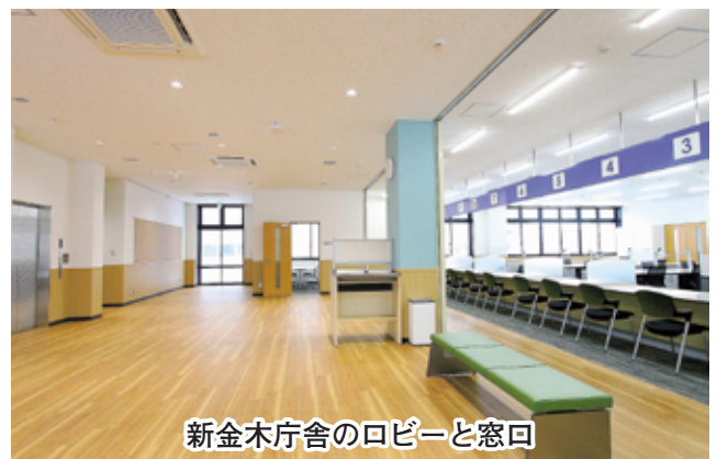
新金木庁舎のロビーと窓口