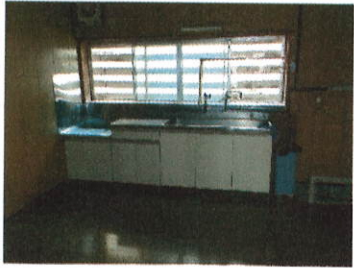
台所 8 丁