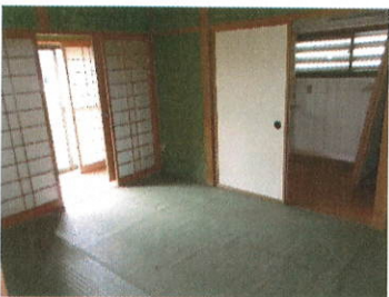
和室 6 丁