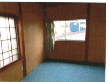
2 階 6 丁