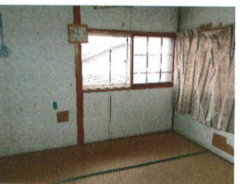
2 階 6 丁