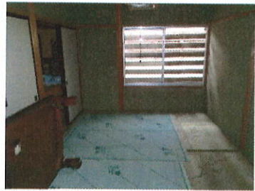
和室 6 丁