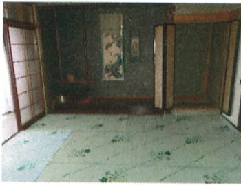
和室 8 丁