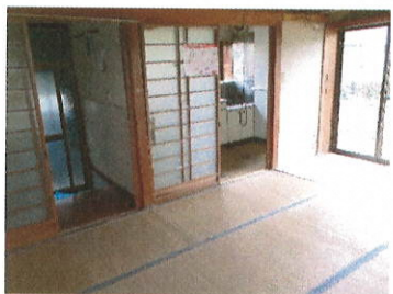
和室 7, 5 丁