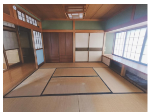
和室（西 8 帖）