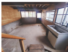
納戸（1 階 13 帖）