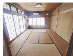
居間（和室 10 帖）