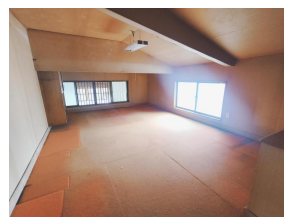
納戸（2 階 12.2 帖）