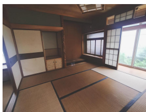
和室（東 8 帖）