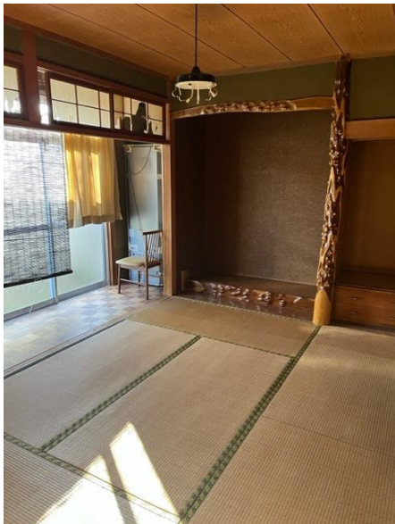
1階 和室 ①