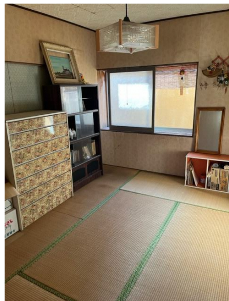
2階 和室 1-2