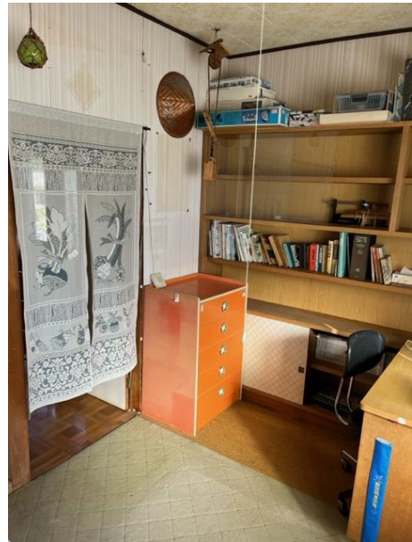
2階 洋室 1-2