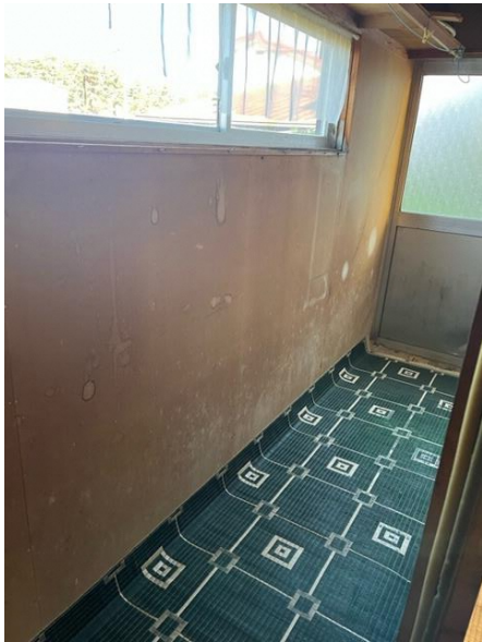
1階 和室 ④からの勝手口