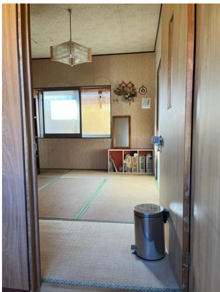
2階 和室 1-1