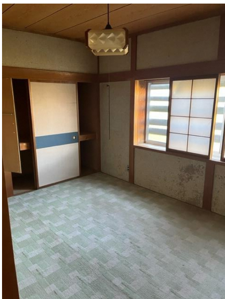
1階 和室 ③