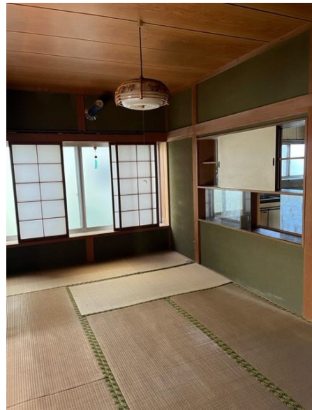
1階 和室 ②