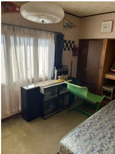
2階 洋室 1-1