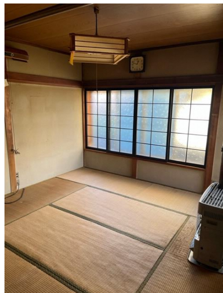
1階 和室 ④