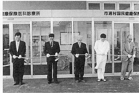
ピンコロ館オープン