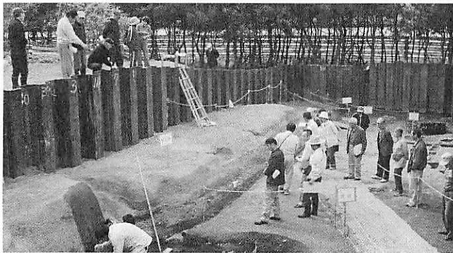
十三湊発掘説明会