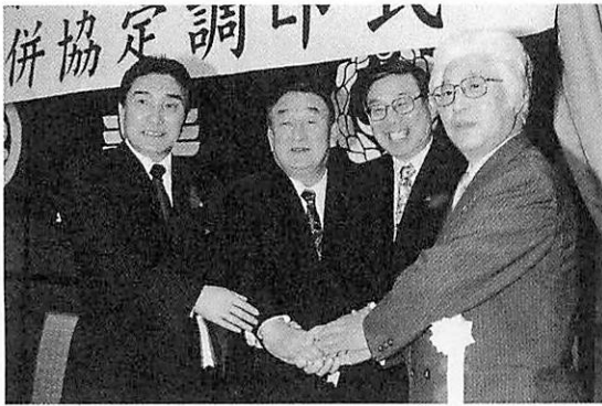
五所川原地域合併協議会設立

この一年を写真で振り返る 二〇〇四年ハイライト。今年も村ではいろいろの行事が行われました。