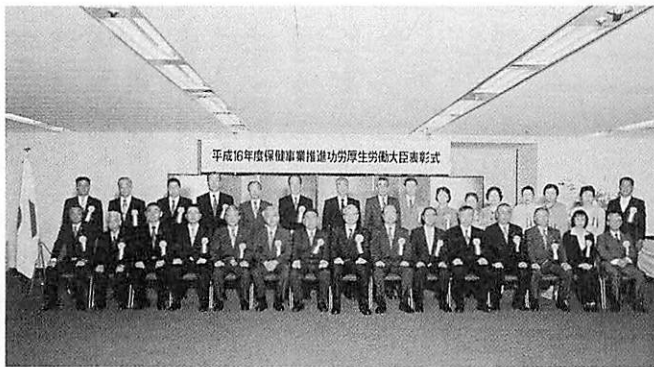
受賞後の記念撮影（左は奈良副参事）