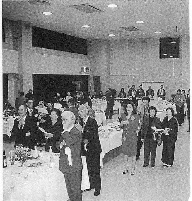
市浦村誕生50年祭・関東ふらさと市浦会10周年記念祝賀会で