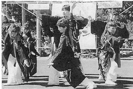
青い森YOSAKOIの集いinしゅうら