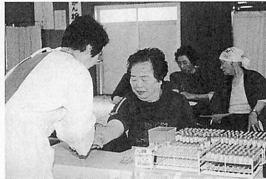
1日ドックを受けて安心