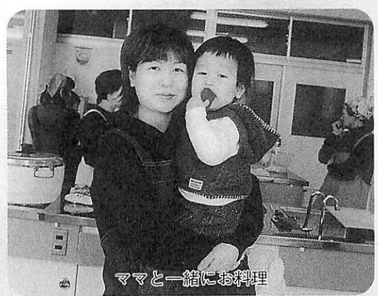
ママと一緒に料理