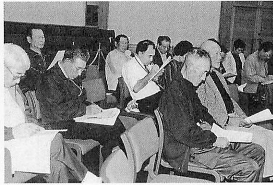
住民説明会の様子