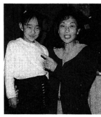
▲娘さんとツーショット

東京に居ながらにしてふるさとがあじわえるのに感謝。田舎に帰っても出かける場所が決まっている。そのため会える人間が限定されているので、