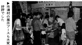
市浦村の展示ブースも大受好評でした。

確かなものにしよという願いを込めて開催したものです。会場には、各市町村が工夫をこらした六十七の展示ブースがずらりと並び、市浦村からは、ふるさと創生一徳円事業で実施した「安信・安東氏展」の写真パネルのほか、ヒバ工芸品、農水産加工品、ヒバハウスの模型など、展示し、安東文化のふるさと、しうら」を売り込みました。特に、ケビンハウスの模型やヒバ人形、シジミエクスドリンクなどが好評で、訪れた人々は、「この前泊って来た所だよ」とか、「シジミエクスドリンクは肝臓に効くんだったら、ヒバ人形を売って欲しい」など、大変好評でした。