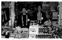
商工会婦人部もPRに一致

去る九月十四日から三日間福島県郡山市で行われた東北むらおこし物産展において、シジミエキドリンク「エキス21」が、栄誉ある東北通商産業局長賞に輝きました。 また、十一月東京で開催される面むらおこし物産展にも出品することになっております。 エキス21は、十三湖で採れるシジミを原料に加工したもので、ビタミン、タンパク質、カルシウム、鉄分などが豊富に含まれ、肝臓病はもとより精力増強や貧血の予防にも効果があるとされています。 むらおこし事業実行委員会では、今後も地域住民から新たな特産品のアイデアを募集するなど、特産品や観光の開発に意欲的に取り組んでいます。