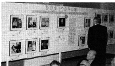
会場では写真パネルも展示