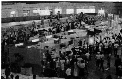
県内67市町村の展示ブースでは、思い思いの飾りつけをして、わがふるさとを売り込みました。

ふるさとあおもりフェスタは、「ふるさとパワー」をテーマに、県内六十七市町村が一堂に会って、地域づくりの成果や夢を披露し合い、それを一般県民の方々に見ていただき、今後の市町村振興に対する情熱を一層熱いものにし、全市町村あるいは全県民の協調と連帯をより