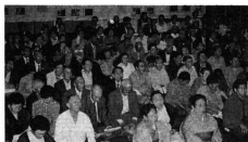
約250人のお年寄りが出席