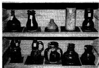
好評を得ている陶芸作品