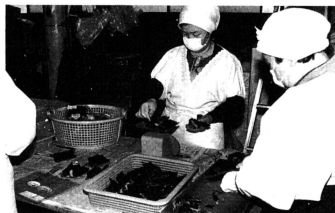
「加工センター」では、地元の主婦6人が働いています。