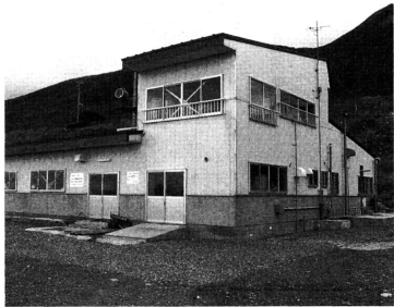
昭和61～62年度の2ヵ年で完成した「あわび中間育成施設」

脇元地区は、津軽海峡を主漁場とした釣漁業と、刺網漁業、沿岸の刺網、あわび、ワカメ等の採取を主体とした磯漁業が営まれています。漁業資源の枯渇、漁具、資材の高騰等、漁家をとりまく環境は、年々厳しさを増しています。