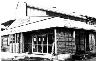
十三地区にある「加工センター」では、農水産物を加工しています。