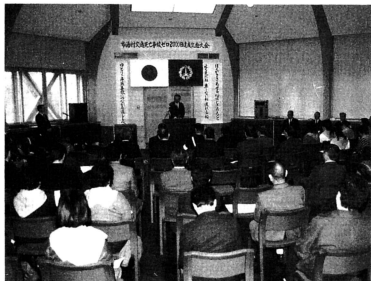
交通安全事故ゼロ2,000日達成記念式典では、2,500日達成を目標に運動を展開することにしました。

に衝突、死亡する事故が起きました。その後、村を挙げて死亡事故抑止に取り組んだことによ