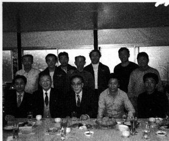
横浜市港北区の「工藤組」で働いているみなさん。