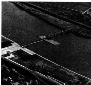
芦野堰(ゴム堰)の上は航行しないようにネッ