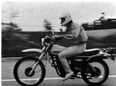
スピードの出しすぎは事故のもとです。こんな乗りかたは絶対にやめたいものです。