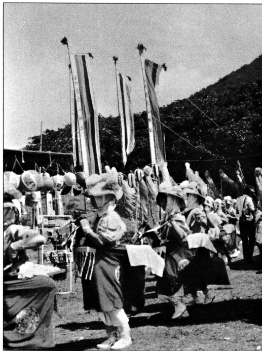
にぎやかにお山参詣 脇元岩木山神社大祭