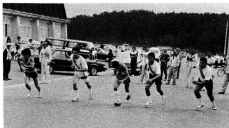
海洋センター前からいっせいにスタート。いつになく参加チームが少く、淋しい大会でした。

スポーツを通して、交通安全意識の高揚と事故のない明るい村づくりを ——と十九日、第五回交通安全駅伝大会が行われま した。