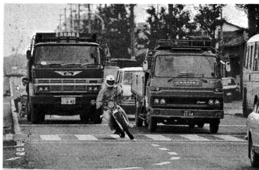
無理な追い越しは危険です。スピードの出しすぎに次いで事故が多くなっています。