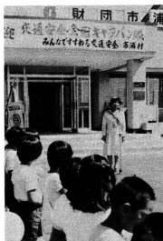
隊旗の引継式には金木高相内分校生ら約100人が集まりました。