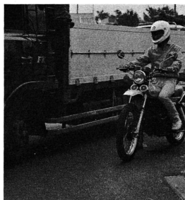
大型車の左折巻き込みに注意しよう。運転は慎重に慎重を重ねて。