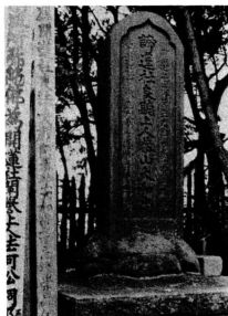
二十五世住職普山大和尚の墓は、漢迎寺本堂入口南側にあります。

歴々二十七代 前述したように本寺は、安倍安東氏が盛大の時から名刹であるとの伝承があり