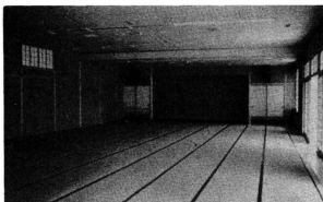
センターの中心となるのは、100畳の和室です。