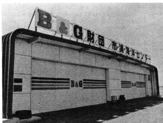
海洋センターの付属施設として完成した艇庫。舟艇の格納が完全にできるようになりました。

B & G 海洋センターの艇庫がこのほど完成しました。さわやかなグリーンに覆われたモダンな建物は、大沼の南側に建てられましたが、これまでポイントやカヌーを格納する所がなかっただけに、海洋クラブの会員たちは、大喜びです。現在、カッター二艘、OPヨット十艘、カヌー十一艘、