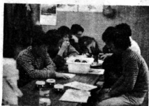
三東工業で働くみなさん