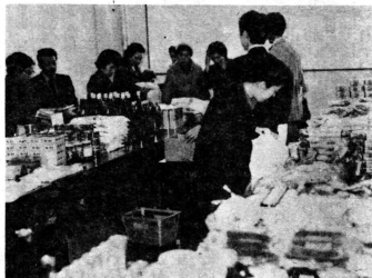
清浄で安全な農産物や加工食品をピーアールする ボランティアグループ

市浦村のボランティアグループがこのほど、基幹集落センターで、自然食品展示即売会を開き、無公害自然食品のピーアールに役かいました。 毎日食べる食物が有害であれば、身体に悪影響をもたらすまでありません。食糧の増産・保存、見ばえをよくするなどといったことから、米、野菜・果物などは生産過程において農薬や化学肥料が、また加工食品にはさまざまな合成食品添加物が使われています。これらの薬品による人体への悪影響については、動物実験等による厳しい検査を経て、認可を得ているものですが、その安全性については一部の学者の間でも熱い議論がなされているところす。 婦人を中心としたボランティアグループでは、「食品公害の実態を認識し、正しい食生活で健康で明るい毎日を送ろう」と、自然食品のピーアールに努めていられるものです。この日も、二十人の会員が参加し、無公害洗剤や自然食品などの販売、食卓を設けて自然食品の試食、食品公害の実態を上映するなど、自然食品の流通供給や自然農法の実施普及につとめています。