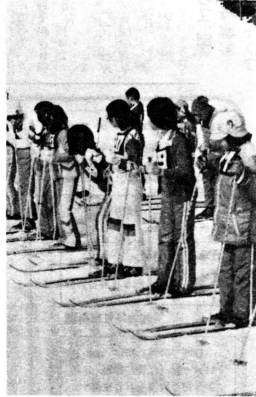
好天に恵まれた相内小のスキー大会は かけつけた父兄の目を楽しませました

相内小学校(小寺町)校長・児童生徒百六十四人、雪でこもりがちな子どもたちの健康増進と体力の向上、スキー技術のレベルアップをはかるため、体育の時間と学校自由活動の中にスキーをとり入れています。年々子どもたちのスキー熱が高まり、スキー部の結成やその技術も向上してきたことから、相互の視察をふくめた校内スキー大会を開催している。