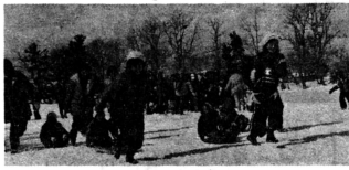
子どもは風の子、元気な声がグラウンドにこだました 雪上ゲーム大会