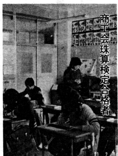
商工会珠算検定合格者