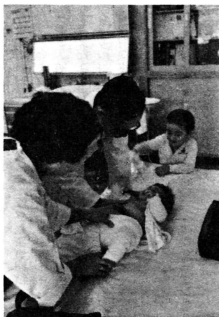
赤ちゃんの健康管理についても指導しています。