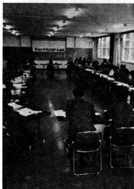
健康であることの確認のために検診は必要です…。共同保健計画会議

「農家の高齢者を対象に、集団検診を行っており、かなりの成果をあげている。検診におけるカルテを持ち帰つた。地元保健婦にアフターケア的