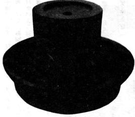
茶 白 壇臨寺跡から出土

思い出多い古城が丘 誰がつけたものでしょうか、その名もゆかしき古城が丘。大字十三南端の野原につけられた名称です。その西側の小高き丘陵地には日清日露以後の戦死者のみ