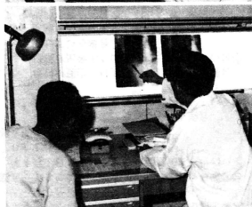
(上) 市浦の住民は高血圧の人が多い……。身体をもっと大切にしくちや。検査結果は、親切にわかりやすく説明している。

崔先生は最後に「この患者さんは、かなり悪化してから来る傾向にある。ガマン強いのも必要ですが、病氣は早期発見、早期治療が一番です。村民のための診療所をどうして利用してほしい」と結びま