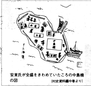
安東氏が全盛をきわめていたころの中島の図 (村史資料編中巻より)

安東水軍の船頭になるためには、さまざまな試験を経て、体格、人格、技術等が衆人にすぐれていなければ