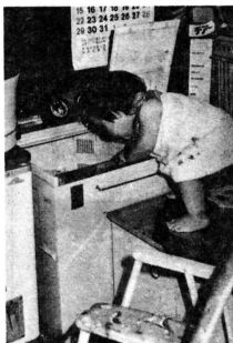
クルクル水のまわる洗濯機… 子供には常に注意の目を。