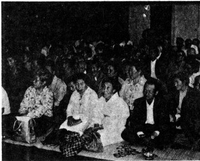
1人1人が協力しあい明るく住みよい幸せな地域社会をつくりあげよう……と語りあいました。

そのあと、芸能保存会によるアトラクションに入り、虫おくりなどを楽しみやかな一日を過ごしました。