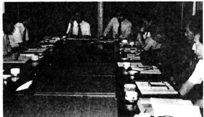
青少年対策の基本方向を決めた委員会。

昭和五十四年度は、市浦村青少年問題協議会は、このほど関係者十六人が出席して役員会議室で開かれ、青少年対策の基本方向や推進目標、具体的実施内容等を決めました。