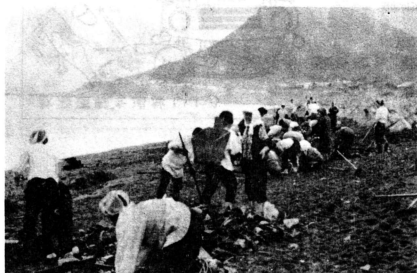
地域ぐるみで海岸清掃が行われています。浜へゴミを捨てないように。