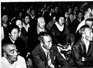
大会は120人のお年寄りが集って盛大に行われました。