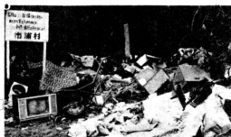
心ない人たちのために、道端もゴミの山

①燃えるゴミ、燃えない ゴミに分ける。②決められ た日に決められた場所に出 す。③入れ物はきちんとし たものを用い外にもれない