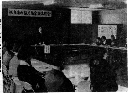
総会であいさつする白川村長