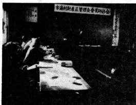
財産区委員も勉強しなくては—と、一生懸命です。

日ごろの勉強不足をカバーしようとして、一月二十八日、財産区管理委員会委員の研修会が役場会議室で開かれました。