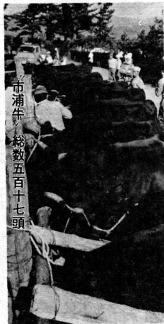
市浦牛 総数五百十七頭