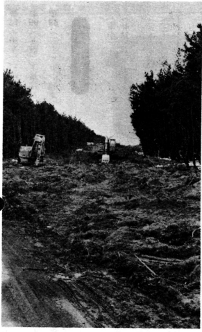
取り付け道路は松林を切り開いて造成工事が進められています。

財政悪化などで工事が大幅に遅れていた十三橋の新設工事が着工され、相内側の取り付け道路四百八十メートルの造成が行われています。 もっとも永久橋の架け替え工事の完成は五十四、五五年ごろという先の長い話ですが、やつと動き出した工事に村民は期待を寄せています。