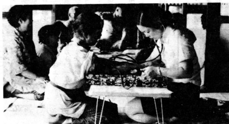
定期的な血圧測定も予防の一つ

十二地区は高血圧者が多く、アタリで死ぬ人が村全体の死因のトップを占めていましたが、村ぐるみの啓発活動、弘大保健医学研究会の健康指導が実を結び、五十年年度の十二地区の発生はゼロ。村全体でもわずか一人と激減しました。