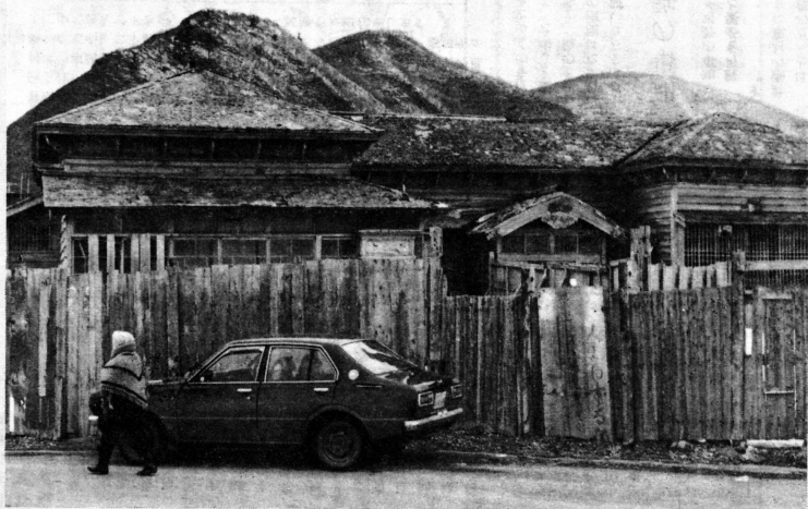
鴨居と杉野の邸宅の板垣にニシン漁船