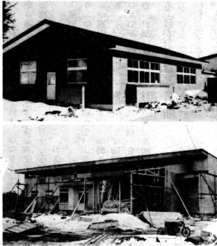
写真(上)室内スポーツもできる集會室 (下)外観もできあがり完成を待つ診療所