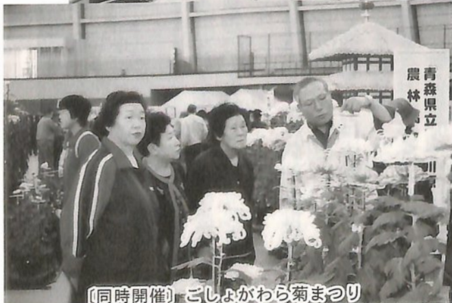
〔同時開催〕ごしよがわら菊まつり