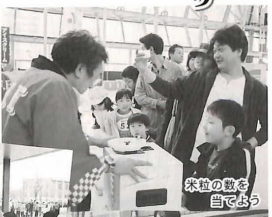
米粒の数を 当てよう