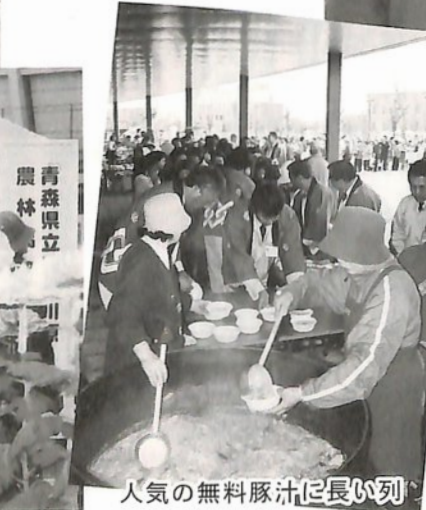
人気の無料豚汁に長い列