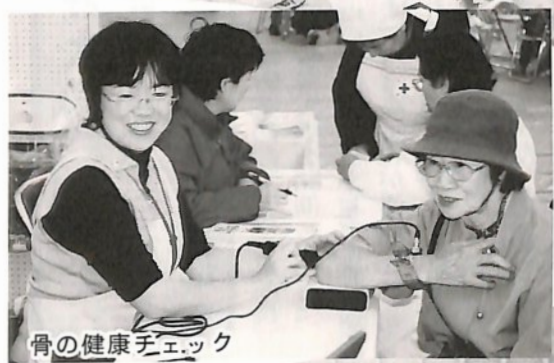
骨の健康チェック