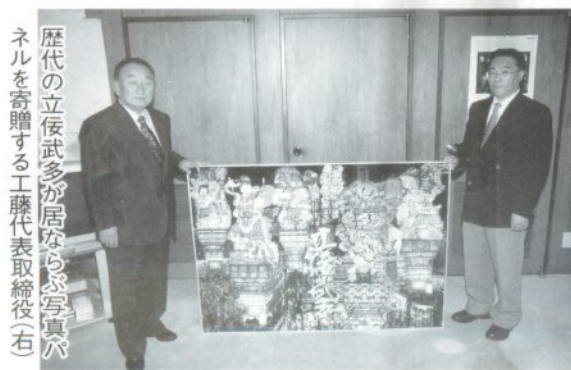
歴代の立佞武多が居ながら写真パネルを寄贈する工藤代表取締役（右）