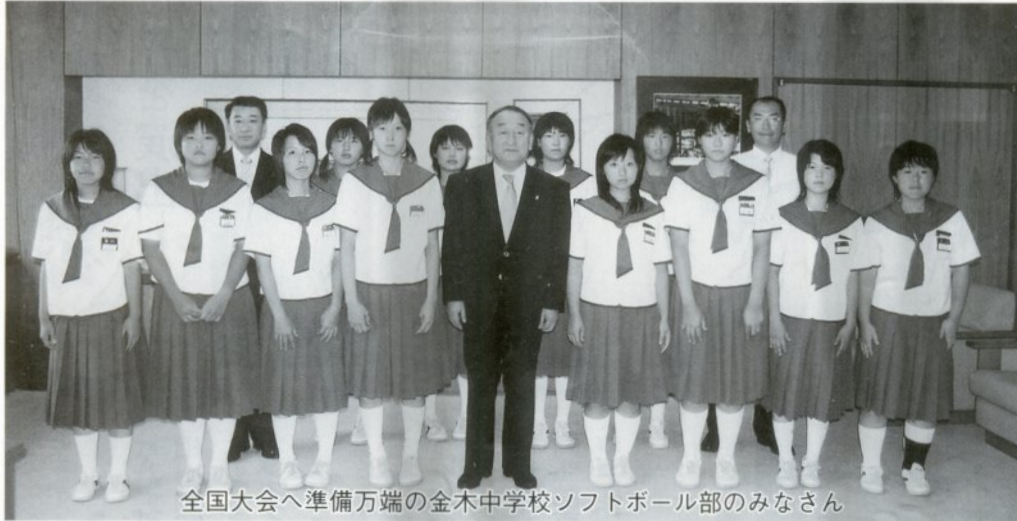
全国大会へ準備万端の金木中学校ソフトボール部のみなさん