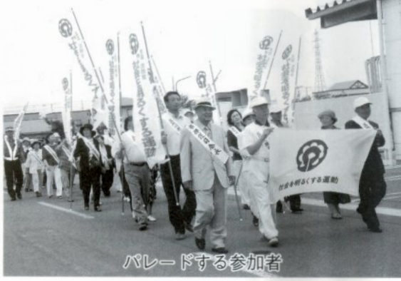
パレードする参加者

その後、一行は警察音楽隊を先頭にエルム第二駐車場からイトーヨーカドー入り口まで街頭パレードしました。