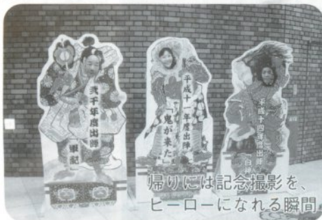
婦人には記念撮影を、ヒーローになれる瞬間

おすすめは北限の梅入り「冷やしうどん」です。ピンク色したうどんが食欲をそそります。もちろん味もバッチリです。