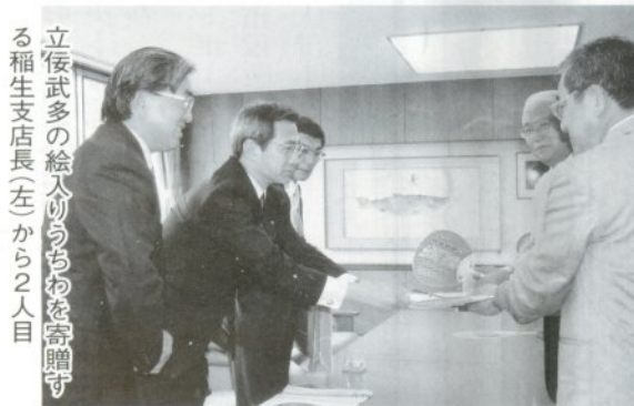
立佞武多の絵入りうちわを寄贈する稲生支店長（左）から2人目