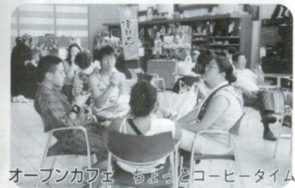
オープンカフェ ちよっとコーヒータイム りんごのソフトクリームが大人気