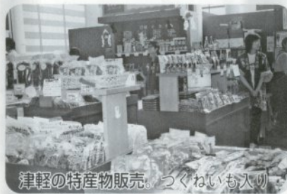
津軽の特産物販売。つくねいも入りまんじゅうなんかいかが。