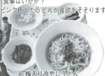
梅入り冷やしうどん