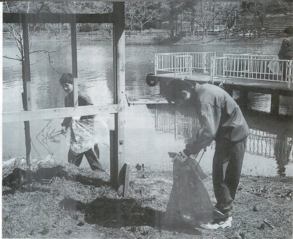
芦野公園 金木中学校・金木高等学校

今月の市民 人口/64,551人 男/30,416人 女/34,135人 世帯数/24,118世帯 3月31日現在