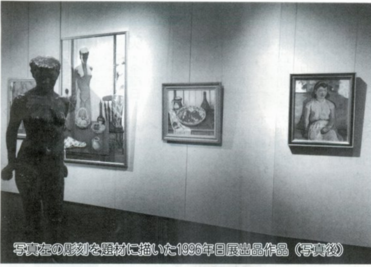
写真左の彫刻を題材に描いた1996年日展出品作品(写真後)