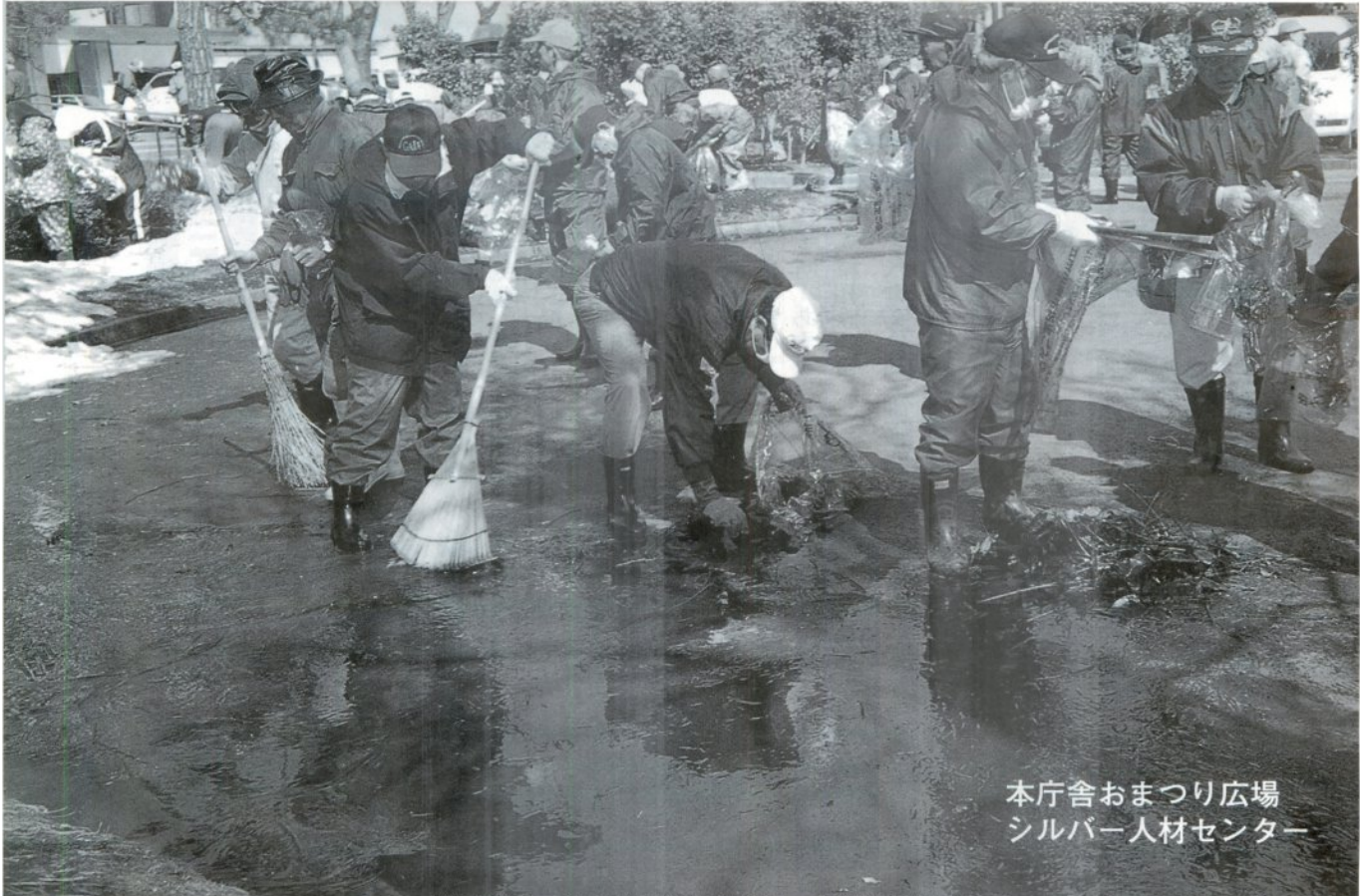
本庁舎おまつり広場 シルバー人材センター