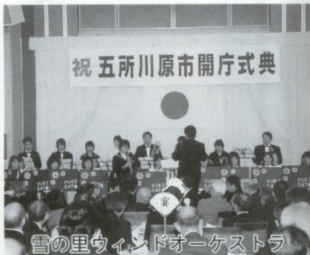
雪の里ウィンドオーケストラ

最後に鏡開きが行われ、参加者は新市誕生を祝うとともに地域の発展を願っていました。