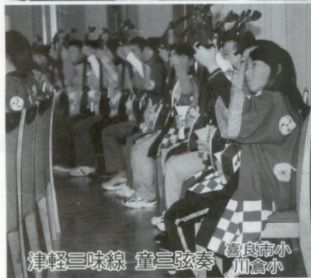
津軽三味線 童三弦奏 喜良市小 川倉小