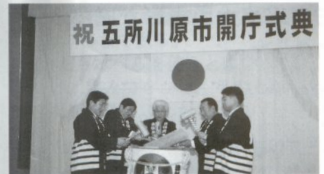
祝 五所川原市開庁式典