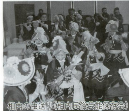
相内の虫送り(相内民俗芸能保存会)