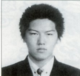
第31回全国高等学校少林寺拳法大会 男子規定組演武の部第1位