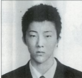
第31回全国高等学校少林寺拳法大会 男子規定組演武の部第1位