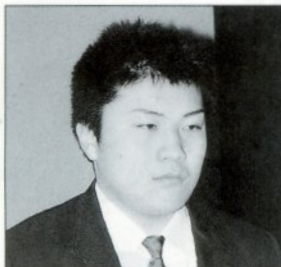
神宮奉納第50回全国高等学校相撲東西対抗大会 個人階級別75kg以上95kg未満級第1位