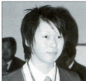
第31回全国高等学校少林寺拳法大会 女子有段組演武の部第1位