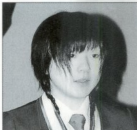
第31回全国高等学校少林寺拳法大会 女子有段組演武の部第1位