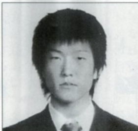
2004年全国少林寺拳法大会 一般二段の部 第1位