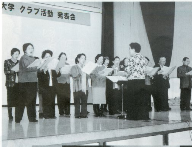
ステージ上で披露された歌謡クラブの合唱(上)と健康体操クラブの実演(下)

この日会場に集い「クラスメイト」の舞台発表を楽しんだ皆さんは、演目が終わるたび、さかんに拍手をしていました。初めて設けられたパソコンクラブでは、基本操作の学習から現在に至るまでをコンピュータを使って説明し、見ていた人は手慣れた操作に感心していました。また、健康体