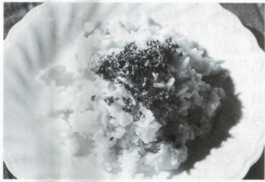
1人分 334kcal 塩分1.3g