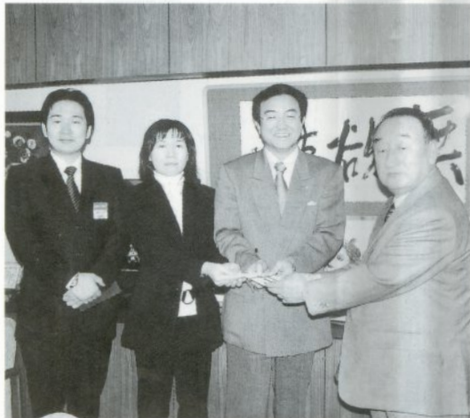
「日頃お世話になっている地域の皆様にも少しでも恩返ができれば…」と話す加賀谷会長(左から3人目)