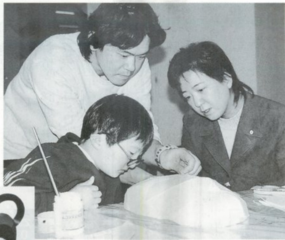
手ほどきを受けて次の作業工程へ お手本(左)のように作れるかな？