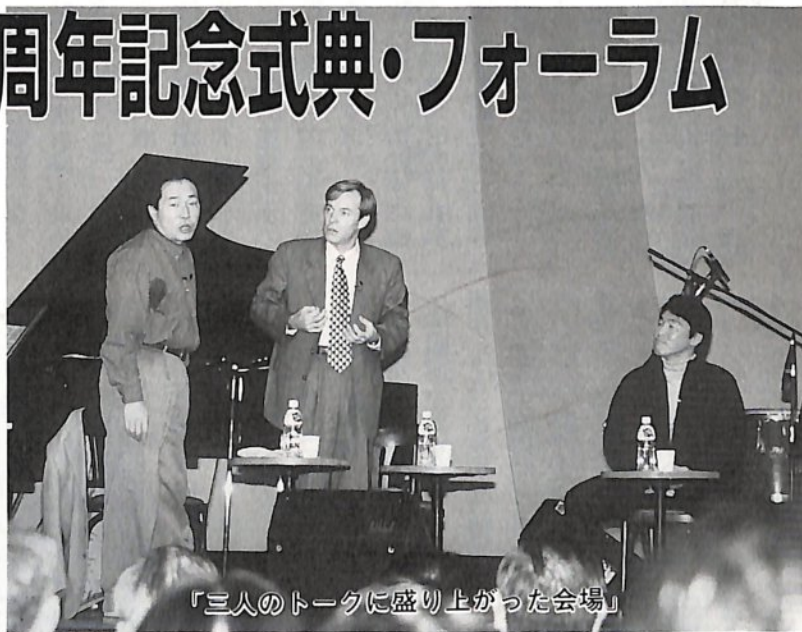
「三人のトークに盛り上がった会場」

津軽平野の母なる川として、古くから地域の発展にかかわってきた岩木川。大正七年、当時の五所川原町に内務省秋田土木出張所岩木川改修工事事務所開設以来、幾多の困難と闘った岩木川治水の歴史も、今年十二月一日で八十周年を迎えました。 式典では先人達の苦勞を讃えるとともに、引き続き、治水・利水両面の整備推進を確認しました。 また、午後のフォーラムではトークライブ、パネルディスカッションが開催されました。 (関連記事2ページ)