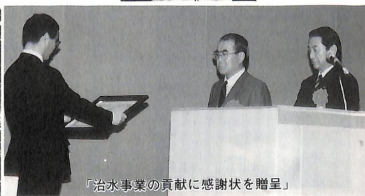
「治水事業の貢献に感謝状を贈呈」