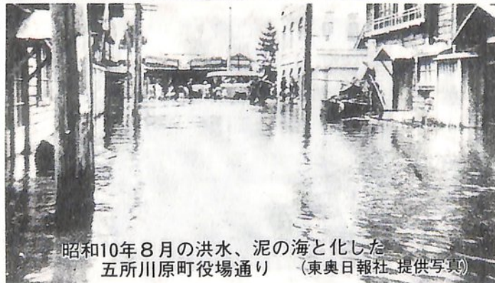
昭和10年8月の洪水、泥の海と化した五所川原町役場通り