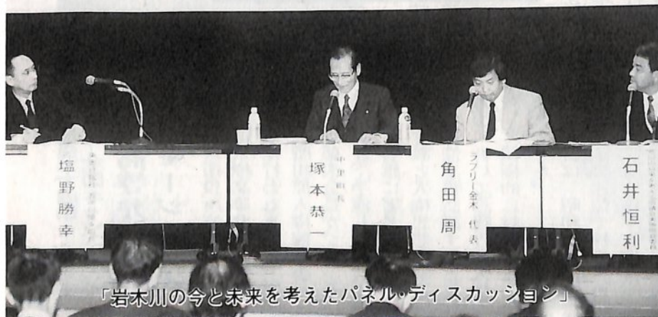
「岩木川の今と未来を考えたパネル・ディスカッション」