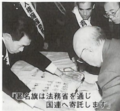
「署名旗は法務省を通じて国連へ寄託します」

世界人権宣言は、昭和二十三年十二月十日に国際連盟で採択されて以来、今年で五十周年を迎え、その間人権保障の国際的進展に大いに寄与しています。