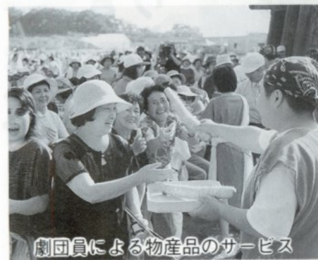
劇団員による物産品のサービス

夕方からは各地域で集められた灯火が知事の持つトーチにまとめられ、五所川原合唱団の合唱を背に縄文の森に誓いの篝火(かがりび)が灯されました。