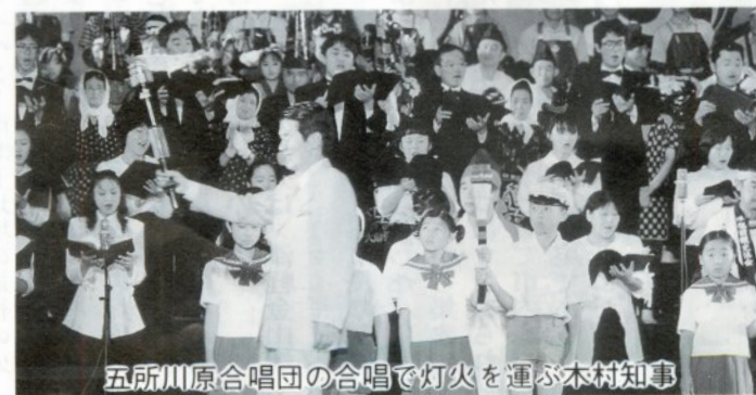
五所川原合唱団の合唱で灯火を運ぶ木村知事