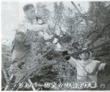
シルバーの方々の剪定作業