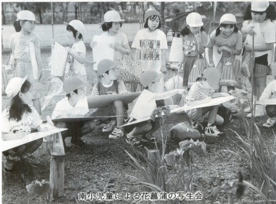
南小児童による花菖蒲の写生会

6月30日現在 ( )内は前回比、男23,953(-3) 女26,708(+2) 計50,661(-1) 世帯17,891(+4)