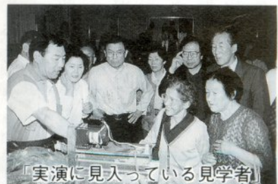
「実演に見入っている見学者」

申請が認可されれば、タケノコの特許としては日本で最初とのこと、ぜひ認可されて愛好者を喜ばせて欲しいものです。