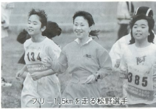
フリー1.5kmを走る松野選手

六月二十八日、北斗運動広場及びジョギングコースにおいてソウルオリンピック一万メートルに出場した松野明美選手を迎え、第九回虫おくり健康マラソン大会が開催されました。