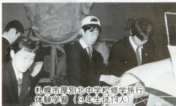
札幌市厚別北中学校修学旅行 体験学習(3年生徒14人)