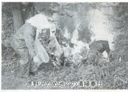
堺野沢ため池での清掃奉仕

六月二十九日、シルバー人材センターの会員二十名が剪定講習会をかねて市役所前おまつり広場の松の剪定を行いました。