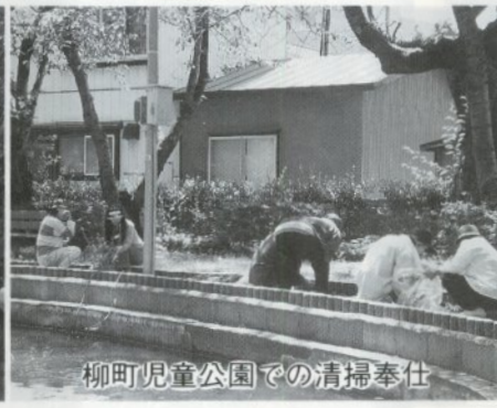
柳町児童公園での清掃奉仕