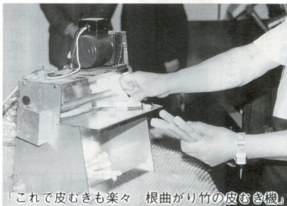
「これで皮むきも楽々 根曲がり竹の皮むき機」

同機は一般家庭向きに、操作性、安全性に細心の注意が払われ、使いやすくなっています。使用方法は、茹でた根曲がり竹を台に乗せて二本のローラーに絡ませるだけで、きれいに皮がむけます。発表会を見学に来た愛好者もその便利さに関心していました。