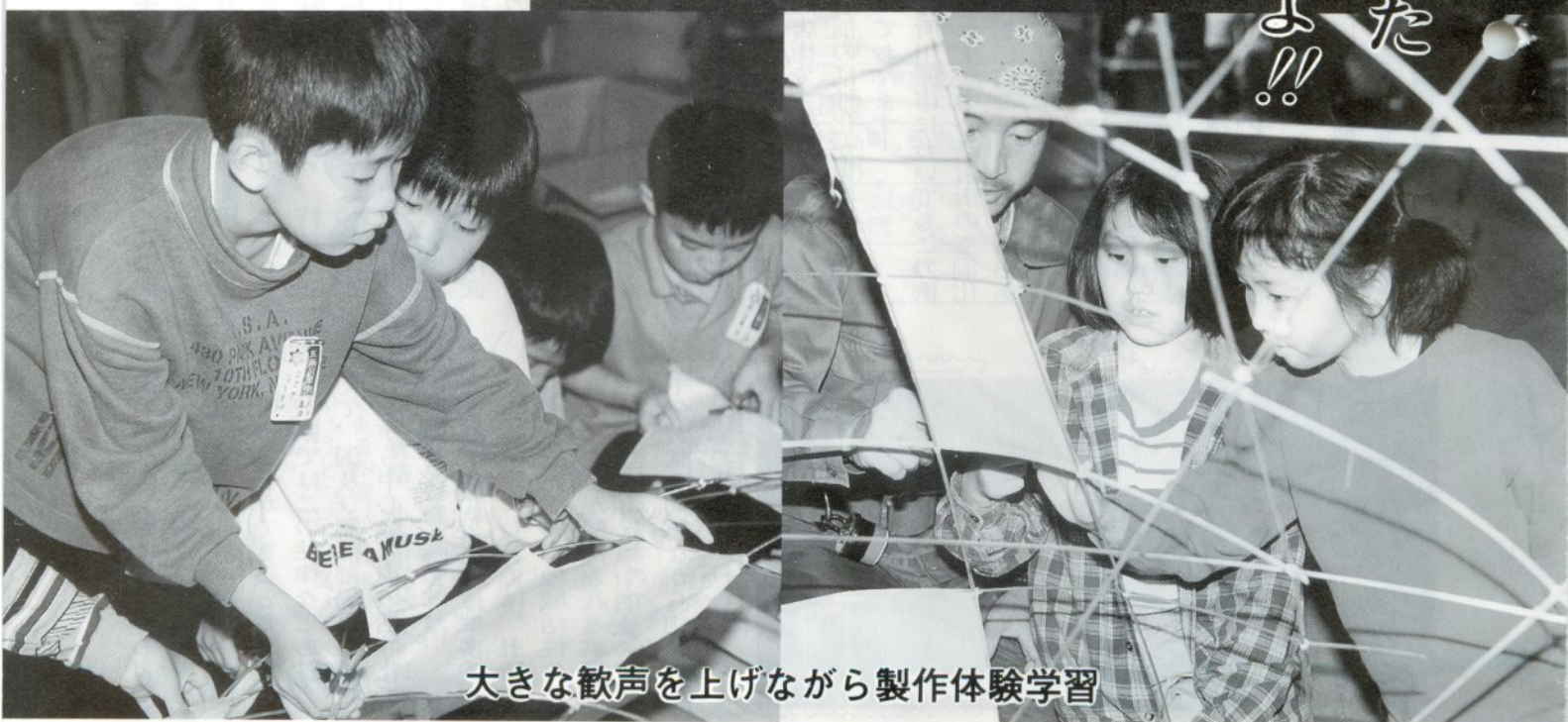
大きな歓声を上げながら製作体験学習