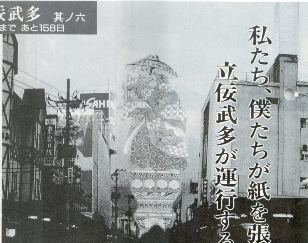
市のシンボルとなる立佞武多の運行予想図